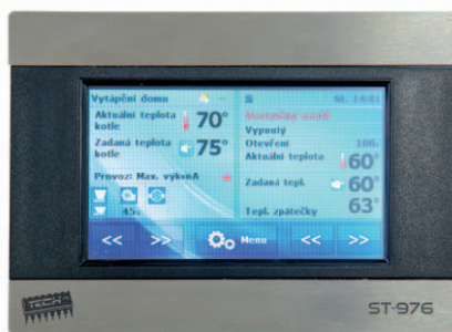
Řídicí jednotka TECH hořáku ROJEK P