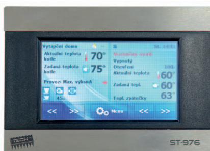
Regulátor horáka ROJEK P