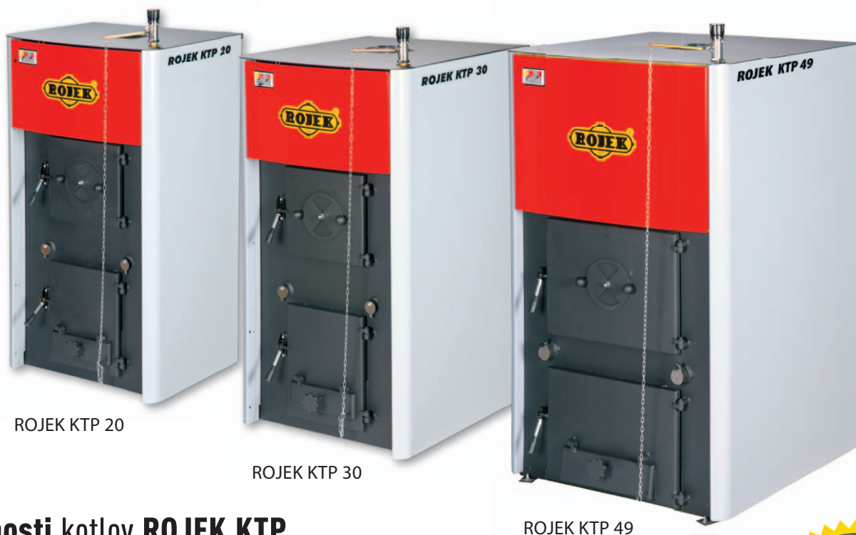
ROJEK KTP 20