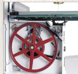
Чугунное колесо и подвижной стол