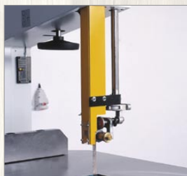
PPS 740, 840