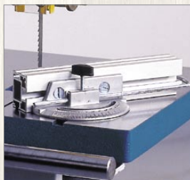
PPS 740, 840