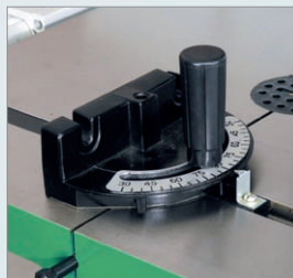
PP 480, PP 600