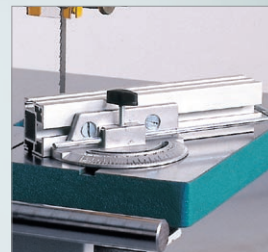
BS 640, 740, 840