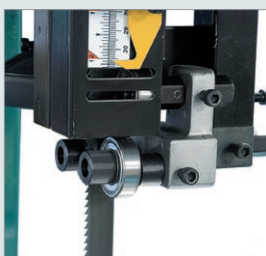
PP 480, PP 600