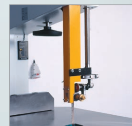
BS 640, 740, 840